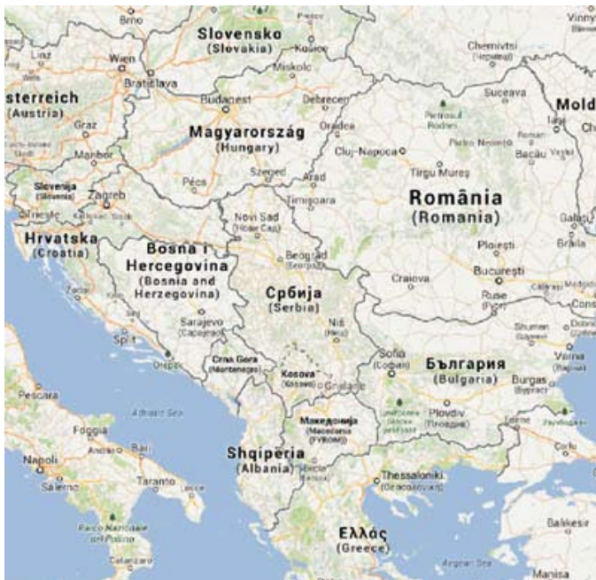
U ovom formatu, /zoom -/ koji manje više pokriva jugoistočnu Evropu, ako se posebno posmatra Kosmet, kako je ovde prikazano, Srbija bez KiM je obeležena sa tri toponima: grad Novi Sad, Beograd i Niš !

A imamo li mi nacionalnu službu koja o tome brine , ili Kragujevac, pošto ga izgleda sa svih strana stalno neko "sapliće", treba da ima svoju!