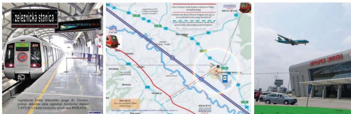
Intermodularni sistem u zoni i funkciji aerodroma Morava /avio, rečni, drumski, železnički/

INTERMODULARNI SAOBRAĆAJNI SISTEM SR.CE /Srbija-Centar/ - je interesno organizacioni skup posebnih postojećih ili stvorenih saobraćajnih modula /železnički, rečni, drumski, avio../ koji tako udruženi doprinose boljitku I delova i celine. Funkcionalna koordinacija, veća efikasnost I racionalizacija poslovanja, odnosno optimizacija operacionalizacije sistema, a sve u interesu građana, odnosno privrede i društva pre svega definisanog regiona ali i zemlje u celini.